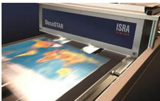
649_1 100 % Druckinspektion von Metalldekorationen mit DecoSTAR