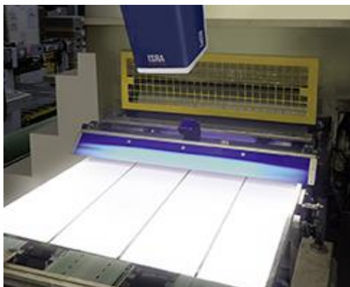
649_2 Schnellere Druckprozesse dank automatischer Einrichtung mit CoatSTAR